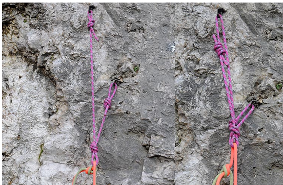
• 1 Collegamento da abbandono su due punti